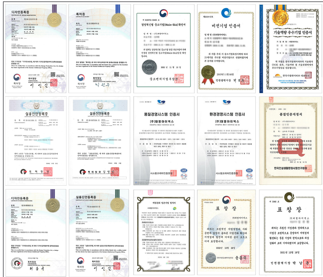
知的財産権（特許および認証書）