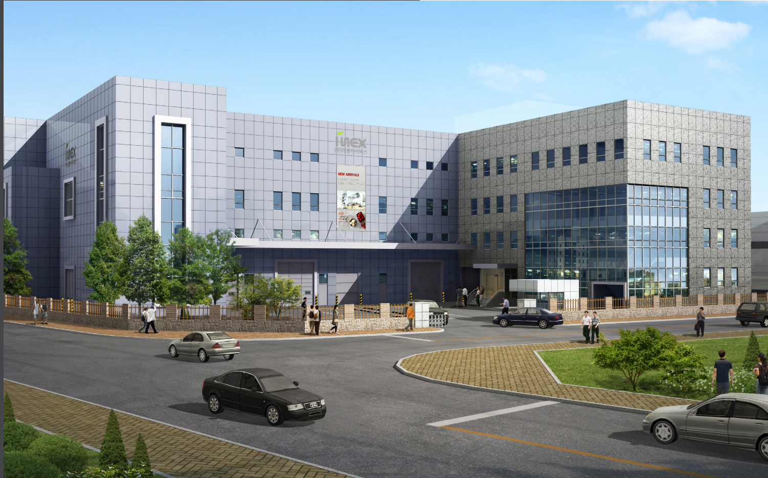
西雲産業団地 新社屋 完成予想図